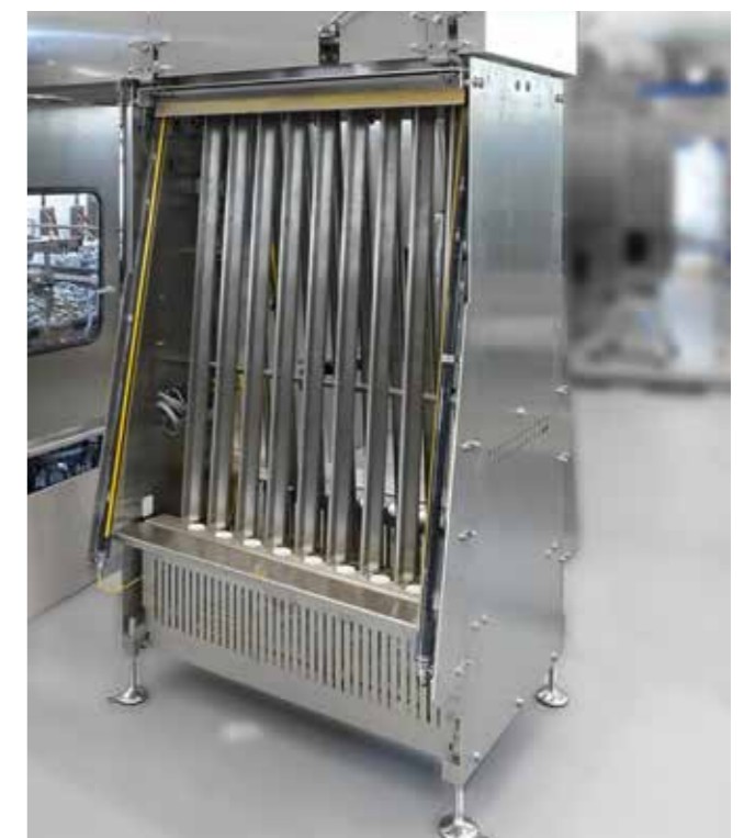
Das neue Deckelzuführungssystem auf Bodenhöhe