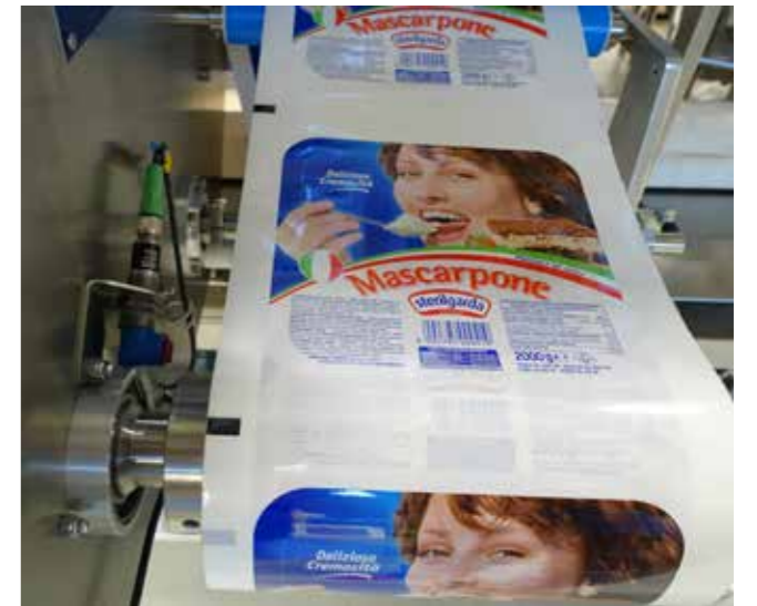
Für maximale Sicherheit, wird die Siegfelie unter pulsierenden UV(C)-Hochleistungslampen entkeimt

Wir bei GRUNWALD tun alles dafür, dass diese weltweit gefragten Produkte auch weiterhin unter höchsten Qualitäts- und Hygienestandards zuverlässig abgefüllt werden. ◆