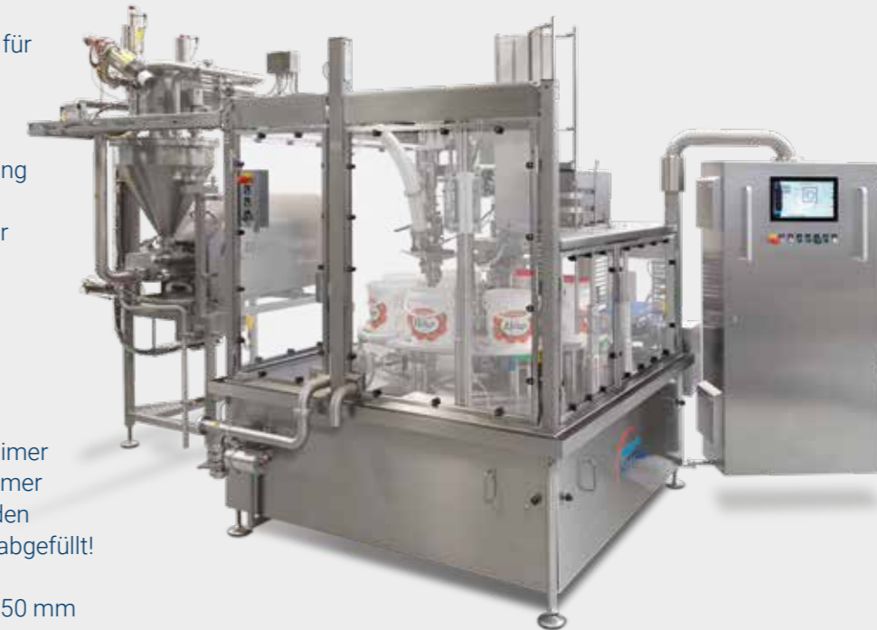
1-bahniger Eimerfüller GRUNWALD-HITTPAC XXL

Hand an einem maßgeschneiderten Konzept, das perfekt auf die Bedürfnisse von FELIX Austria abgestimmt ist und liefert letztlich eine beeindruckende Lösung.