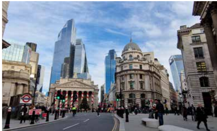
London – eine Stadt voller Kontraste