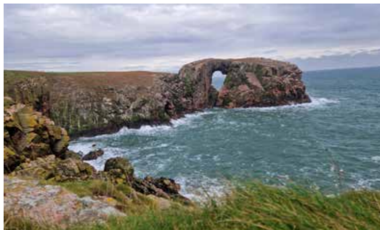
Wilde Schönheit - die Küste Schottlands