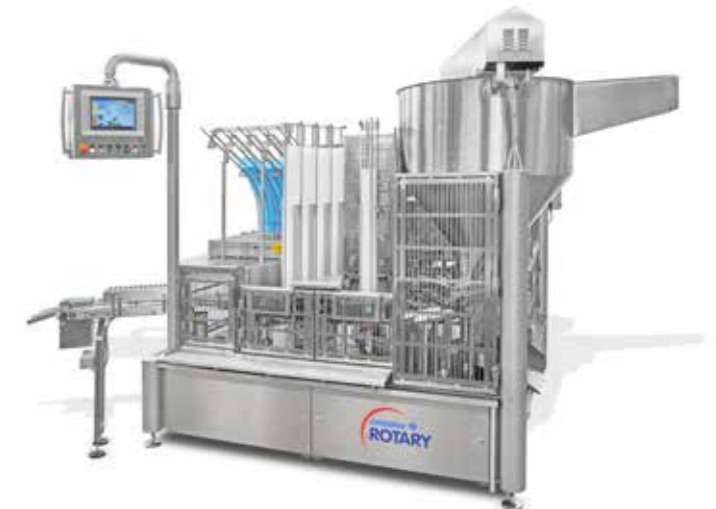
Becherfüller GRUNWALD-ROTARY 20.000 - einer, der in jüngster Zeit gelieferten Rundläufer

Wie bewerten Sie die Zusammenarbeit mit GRUNWALD? Die Zusammenarbeit mit GRUNWALD ist hervorragend. Die Worte, die mir hierzu sofort einfallen, sind Offenheit, Transparenz und Qualität.