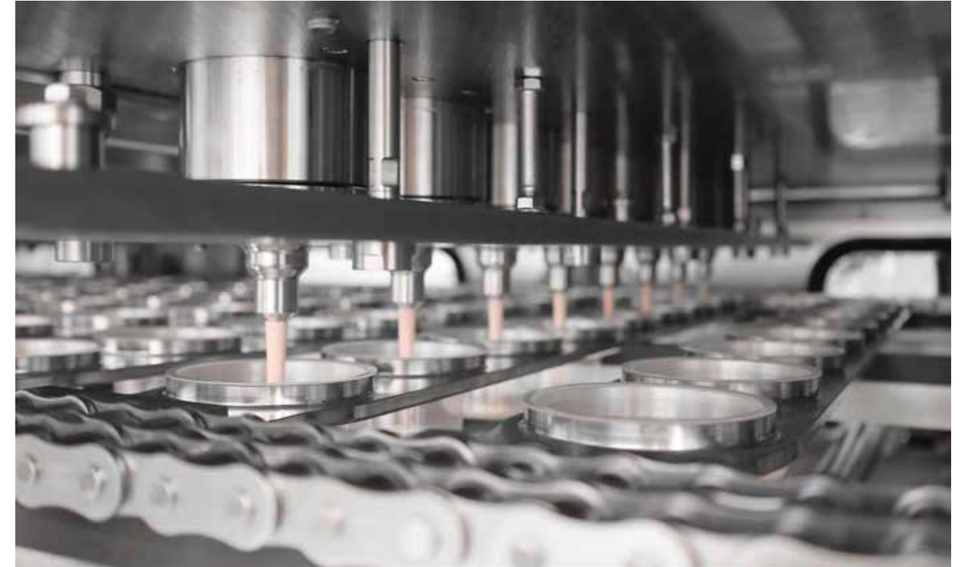
Abfüllung von gerührtem Joghurt auf der vollautomatischen Becherabfüll- und Verschleißanlage GRUNWALD-FOODLINER 20.000UC in 2x8-bahniger Ultra-Clean-Ausführung

mit einzigartigem Hygienestandard und Präzision - verarbeiten 80.000 Becher und 36.500 kg Produkt pro Stunde!