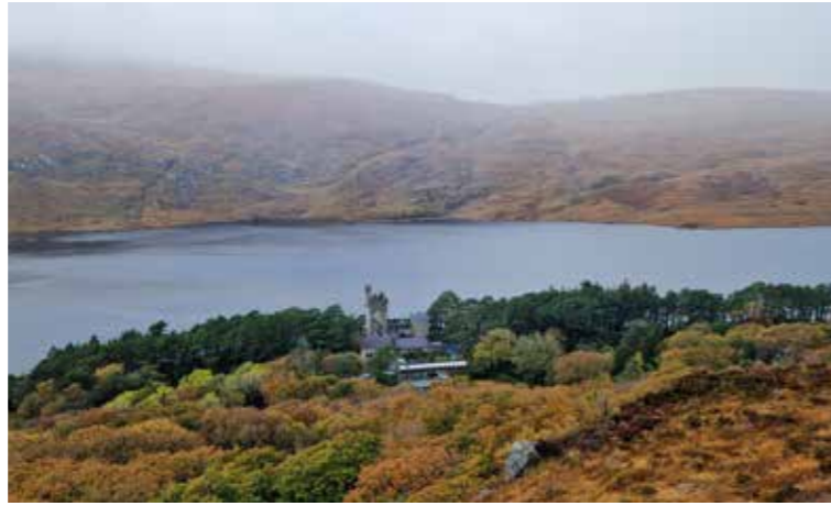
Herbst im Glenveagh Nationalpark (Irland)

An dieser Stelle möchte ich meinem Partnerunternehmen GRUNWALD nochmals herzlich danken, das durch seine großartige Unterstützung und Förderung mein Auslandssemester und diese einmaligen Erfahrungen erst möglich gemacht hat. ♦